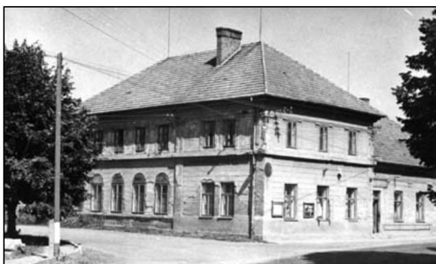
rok 1975 – před rekonstrukcí