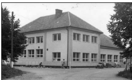
rok 1978 - po rekonstrukci