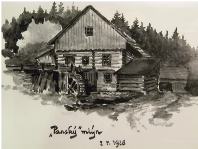
OBR.: kresba panského mlýna od J. Maisnera v Hejzlarově kronice

Panský mlýn již nestojí. Jednu z nejkrásnějších mlýnských staveb našeho kraje zničila povodeň v roce 1998. Z původní roubené stavby nezůstalo vůbec nic, až na pár fotografií, kreseb a vzpomínek.