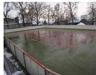
OBR.: brigáda na hřišti v BÚ (vlevo, nahoře), ledová plocha (vpravo)

Ostatní informace o dění v klubu (termíny tréninků, případné tréninkové zápasy, atd.) najdete na našich internetových stránkách www.hcbu.cz