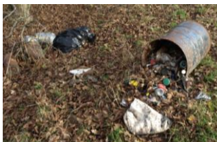
OBR.: odpady na Ostrově